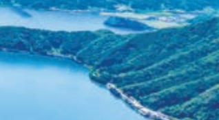
レインボーライン山頂公園(手前中央)と三方五湖を望む

はるか京都府丹後半島 経が岬~福井県 越前岬に至る若狭湾のパノラマが特徴のテラス。春には常神半島のヤマザクラを望む人気スポット。