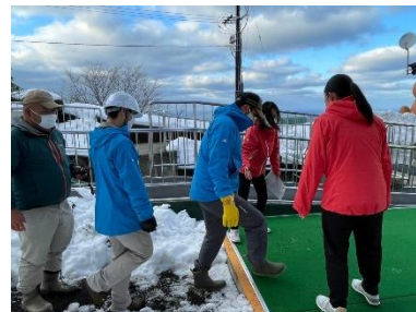
(総合防災訓練 2021年度 1月24日 救助訓練を実施)